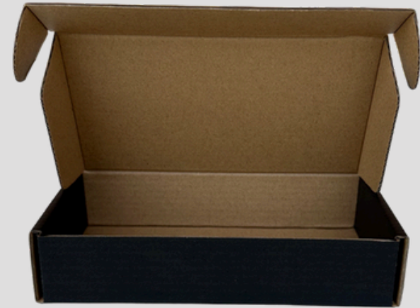
● CARTÓN CLARO